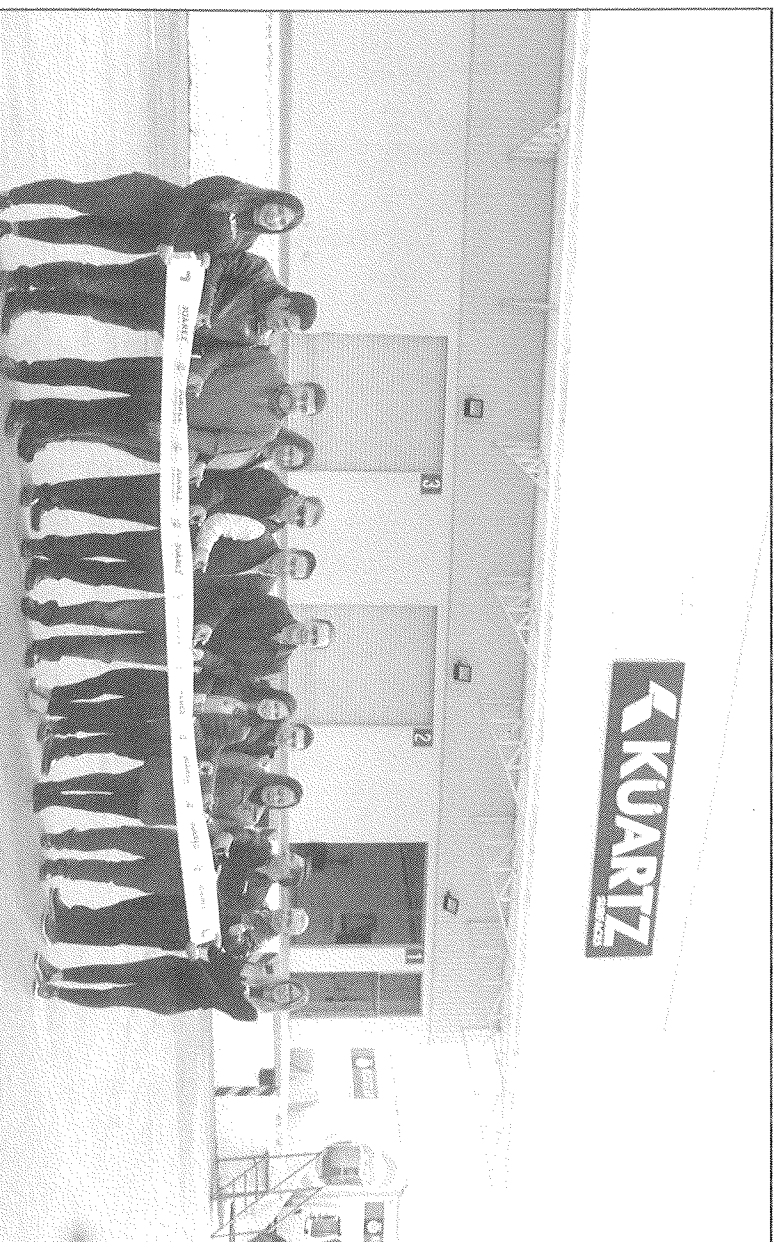
El alcalde Heriberto Treviño Cantú cortó el listón inaugural de la empresa Kuartz.